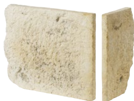
5 Pierre demi-angle