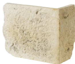
3 4 Pierre d'angle