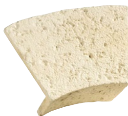
2 Élément de voute R45° 5 éléments pour un arc de 90 cm (ouverture 95 cm)