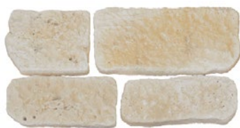
1 Parement Moellon Assisé ■ 35,7 kg/m 2